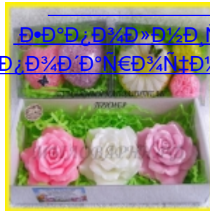
Սրբապատկերի զարդարություններ Սրբապատկերի զարդարություններ (21)