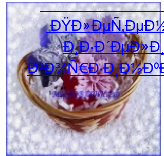
Սրբապատկերի զարդարություններ Սրբապատկերի զարդարություններ (19)