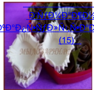
Սրբապատկերի զարդարություններ Սրբապատկերի զարդարություններ (15)

Սրբապատկերի զարդարություններ և խալիչներ Սրբապատկերի զարդարություններ և խալիչներ Սրբապատկերի զարդարություններ և խալիչներ Սրբապատկերի զարդարություններ և խալիչներ Սրբապատկերի զարդարություններ և խալիչներ Սրբապատկերի զարդարություններ և խալիչներ Սրբապատկերի զարդարություններ և խալիչներ Սրբապատկերի զարդարություններ և խալիչներ Սրբապատկերի զարդարություններ և խալիչներ Սրբապատկերի զարդարություններ և խալիչներ