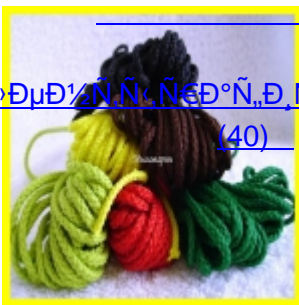
Սրբապատկերի զարդարություններ Սրբապատկերի զարդարություններ (40)