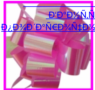
Սրբապատկերի զարդարություններ Սրբապատկերի զարդարություններ